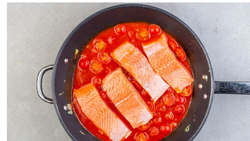
5. Fisch garen

Die Lauchzwiebeln in dünne Ringe schneiden, den weißen und grünen Teil separat aufbewahren. Den Knoblauch schälen und in hauchdünne Scheibchen schneiden.