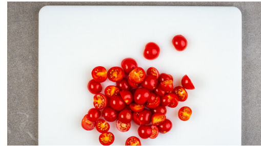
2. Tomaten schneiden

Schau dir das Rezept in deinem Konto auf marleyspoon.de an. Instagram Facebook Twitter Pinterest #marleyspooning