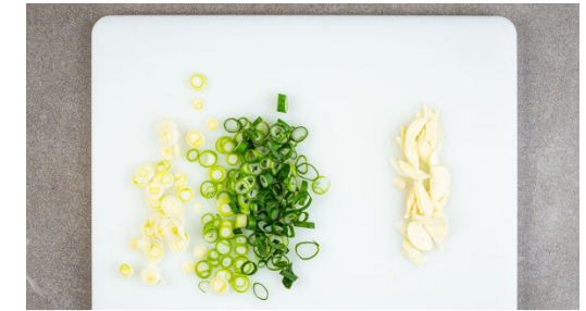
3. Lauchzwiebeln schneiden

Die Lauchzwiebeln in dünne Ringe schneiden, den weißen und grünen Teil separat aufbewahren. Den Knoblauch schälen und in hauchdünne Scheibchen schneiden.