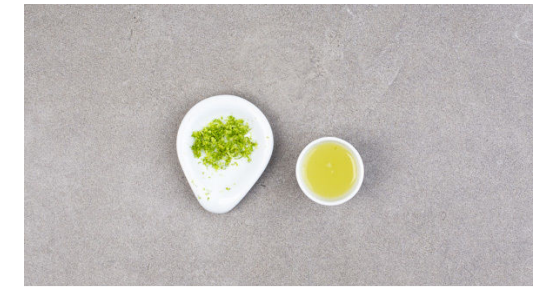
3. Limetten vorbereiten

Das Fleisch trocken tupfen und in 1-2cm kleine Würfel schneiden.