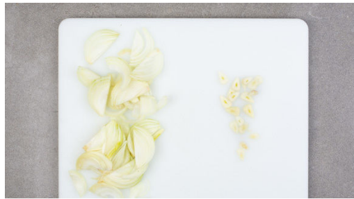
1. Zwiebel schneiden

Energie 924kcal, Fett 41.1g, Kohlenhydrate 91.2g, Eiweiß 46.0g