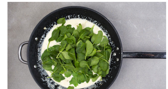
6. Sauce zubereiten

Das Fleisch mit je 1 kräftigen Prise Salz und Pfeffer würzen und in einer zweiten großen Pfanne mit 2EL Olivenöl bei mittlerer Hitze rundum 3-4Min. anbraten. Anschließend das Fleisch aus der Pfanne nehmen und auf einem Teller abgedeckt ruhen lassen.