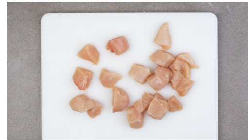
2. Fleisch schneiden

Die Zwiebel schälen, halbieren und in feine Streifen schneiden. Den Knoblauch schälen und in feine Scheibchen schneiden.