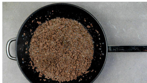
2. Hackfleisch braten

In einem großen Topf ausreichend gesalzenes Wasser für die Pasta zum Kochen bringen. Die Pilze ggf. säubern und in dünne Scheiben schneiden, dann in einer großen Pfanne mit 2EL Butter oder Pflanzenöl und 1 kräftigen Prise Salz bei mittlerer Hitze in 7-8Min. goldbraun braten.