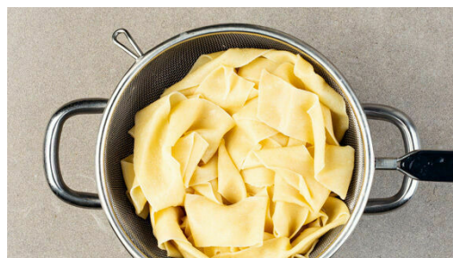
5. Pasta kochen

Die Zwiebeln schälen, halbieren und in feine Streifen schneiden, dann in einer mittelgroßen Pfanne mit 2EL Butter oder Pflanzenöl sowie 2TL Zucker und 1TL Salz bei mittlerer Hitze 4-5Min. goldbraun karamellisieren, dabei gelegentlich umrühren.