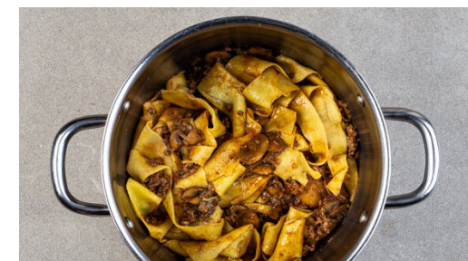
6. Pasta vermengen

Die Lasagneblätter der Länge nach in ca. 2,5cm breite Streifen schneiden, in das kochende Wasser geben und in ca. 5Min. bissfest kochen. Mit einer Tasse etwas Pastawasser abschöpfen, dann die Pasta in ein Sieb abgießen und abtropfen lassen.