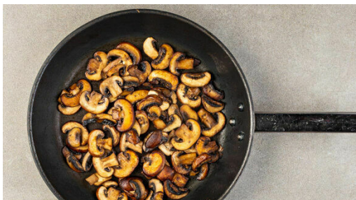
1. Pilze braten

Energie 847kcal, Fett 37.3g, Kohlenhydrate 84.0g, Eiweiß 45.6g