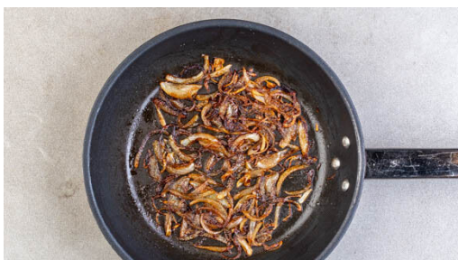
4. Zwiebeln karamellisieren

Die Tomaten grob würfeln und in einem hohen Gefäß mit einem Stabmixer fein pürieren. Das Tomatenpüree mit den Pilzen , dem Brühgewürz und der Sojasauce zum Hackfleisch geben und bei niedriger Hitze ca. 10Min. köcheln lassen. Tipp: Für eine flüssigere Sauce 100-150ml Wasser zugeben und mitköcheln.