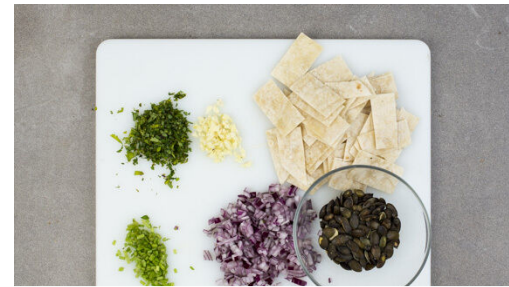
2. Zutaten vorbereiten

Verzichte auf gedruckte Rezepte – ändere die Einstellungen im Kundenkonto. Fragen zur Zubereitung oder zum Rezept? Deine Koch-Hotline: 030 208 480 510