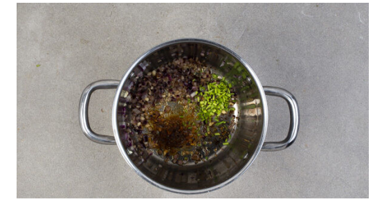
3. Zwiebeln braten

Die Pfanne ca. 0,5cm hoch mit Olivenöl befüllen und das Öl mittelhoch erhitzen. Die Tortillastücke ggf. in mehreren Portionen in 1–2Min. goldbraun ausbacken. Nach Bedarf die Hitze reduzieren, falls die Tortillas zu schnell dunkel werden. Auf etwas Küchenkrepp abtropfen lassen, dann mit je 1 Prise Chiliflocken und Salz vermengen.