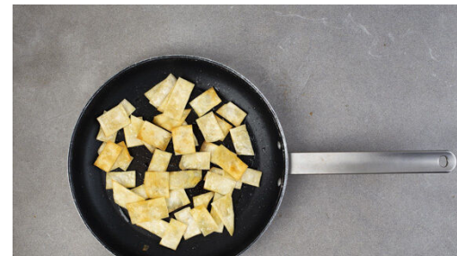
5. Tortillachips zubereiten

Die Kürbiskerne in einer großen Pfanne ohne Zugabe von Fett bei mittlerer Hitze 2–4 Min. anrösten. Zum Abkühlen aus der Pfanne nehmen und auf einem Teller beiseitestellen. Die Zwiebel und den Knoblauch schälen und grob würfeln. Die Korianderblätter abzupfen, die Blätter und die Stängel getrennt voneinander fein schneiden. 4 Tortillas in mundgerechte Stücke schneiden.