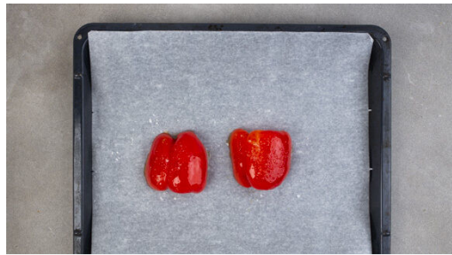
1. Paprika rösten

Den Backofen mit Grillfunktion oder Ober-/ Unterhitze auf 250°C vorheizen. Die Paprika halbieren, entkernen und mit der Schnittfläche nach unten auf ein mit Backpapier ausgelegtes Backblech geben. Mit 1TL Olivenöl bestreichen und mit 1 Prise Salz würzen, dann ca. 15Min. auf der oberen Schiene im Ofen rösten, bis die Haut dunkle Blasen wirft. Aus dem Ofen nehmen und etwas abkühlen lassen.