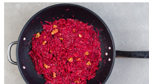
5. Sauce zubereiten

Die ½ der Roten Bete mit einer Küchenreibe grob raspeln. Tipp: Da Rote Bete stark färbt, am besten mit Küchenhandschuhen und Schürze arbeiten. Den Knoblauch schälen und fein würfeln.