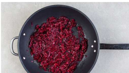
4. Rote Bete braten

In einem mittelgroßen Topf ausreichend gesalzenes Wasser für die Pasta zum Kochen bringen. Die Walnüsse grob hacken und in einer großen Pfanne ohne Zugabe von Fett bei mittlerer Hitze 1-2Min. anrösten. Vorsicht , sie können schnell zu dunkel werden. Zum Abkühlen aus der Pfanne nehmen und beiseitestellen.