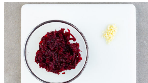
2. Rote Bete reiben

Die Rote Bete und den Knoblauch in der Pfanne mit 1EL Olivenöl bei mittlerer Hitze 2-3Min. braten. Mit 1EL Balsamicoessig ablöschen und mit Salz und Pfeffer abschmecken.