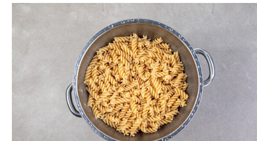
3. Pasta kochen

Die ½ des Ziegenfrischkäses , die ½ der Walnüsse und 1EL Butter unter die Rote Bete mengen und löffelweise Pastawasser hinzufügen, bis die Sauce eine cremige Konsistenz erhält. Nochmals mit Salz und Pfeffer abschmecken.