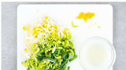
1. Lauch schneiden

Energie 748kcal, Fett 40.1g, Kohlenhydrate 47.7g, Eiweiß 44.3g