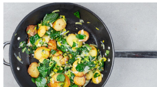
5. Kartoffeln braten

Die Kartoffeln in das kochende Wasser geben und je nach Größe in 10-15Min. bissfest garen. In ein Sieb abgießen und etwas abkühlen lassen.