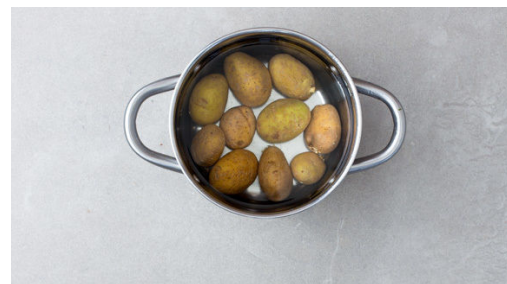
2. Kartoffeln kochen

Die Kapern grob hacken und mit 3-4EL Olivenöl, 2-3EL Zitronensaft , 1EL Wasser, dem Zitronenabrieb sowie Salz, Pfeffer und 1 Prise Zucker zu einem Dressing verrühren.