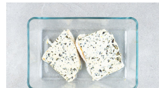
6. Fisch garen

Die Kürbiskerne grob hacken, mit Salz und Pfeffer würzen und mit 4EL weicher Butter vermengen. Die Semmelbrösel untermengen. Die Kürbiskernbutter zwischen Frischhaltefolie ca. 0,5cm dick ausrollen, mit der Folie auf einen Teller legen und in den Kühlschrank stellen.