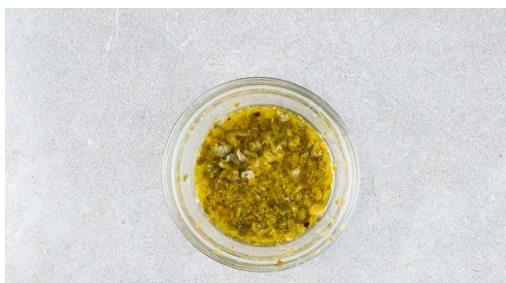
4. Dressing zubereiten

Den Backofen mit Grillfunktion auf 250°C vorheizen. In einem mittelgroßen Topf ausreichend gesalzenes Wasser für die Kartoffeln zum Kochen bringen. Den Lauch längs halbieren und in ca. 0,5cm dünne Streifen schneiden. Die Zitronenschale abreiben, dann die Zitrone halbieren und auspressen.