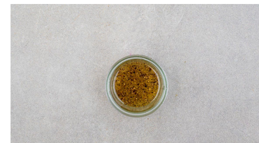
6. Dressing anrühren

Das Sauerkraut in ein Sieb abgießen und abtropfen lassen, dabei so viel Flüssigkeit wie möglich herausdrücken. Die Tomaten in dünne Scheiben schneiden. Den Eisbergsalat halbieren und in dünne Streifen schneiden.