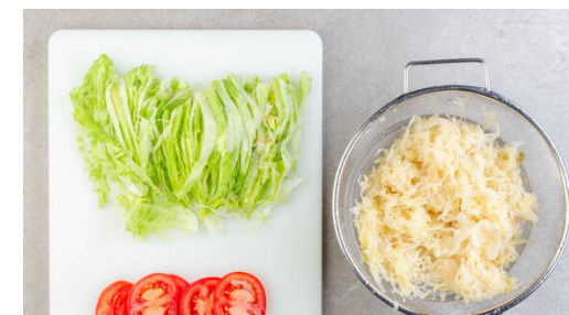
3. Gemüse vorbereiten

Wenn der Käse geschmolzen ist, die Sandwichhälften aus dem Ofen nehmen. Nach Belieben mit etwas Salat und den Tomatenscheiben belegen und die Sandwiches schließen.