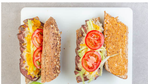
5. Sandwiches fertigstellen

Das Fleisch trocken tupfen, von beiden Seiten mit Salz und Pfeffer würzen und in einer großen Pfanne mit 2EL Olivenöl bei starker Hitze auf jeder Seite ca. 1Min. scharf anbraten. Anschließend in eine Auflaufform geben und 5-7Min. im Ofen garen, dann abgedeckt auf einem Teller außerhalb des Ofens ruhen lassen.