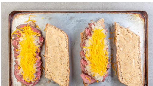
4. Brötchen belegen

Den Backofen auf 200°C (180°C Umluft) vorheizen. 4EL Mayonnaise mit 2EL körnigem Senf und 2EL Ketchup verrühren und mit Salz und Pfeffer abschmecken. Die Karotten ggf. schälen und quer halbieren, dann in ca. 1cm breite Streifen schneiden. Auf einem mit Backpapier ausgelegten Backblech mit 2EL Olivenöl und je 1 kräftigen Prise Salz und Pfeffer mischen und im Ofen in 20-25Min. goldbraun rösten.