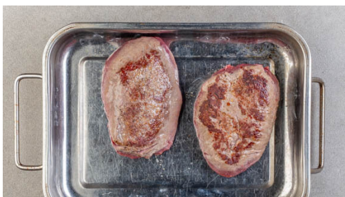
2. Fleisch garen

Schau dir das Rezept in deinem Konto auf marleyspoon.de an. Instagram Facebook Twitter Pinterest #marleyspooning