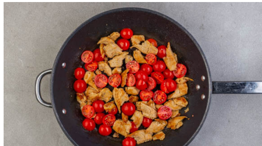
4. „Hähnchen“ braten

In einem mittelgroßen Topf ausreichend gesalzenes Wasser für die Pasta zum Kochen bringen. Die Walnüsse in einer großen Pfanne bei mittlerer Hitze ohne Zugabe von Fett 1-2Min. anrösten. Vorsicht , sie können schnell zu dunkel werden. Zum Abkühlen auf einem Teller beiseitestellen, die Pfanne aufbewahren.