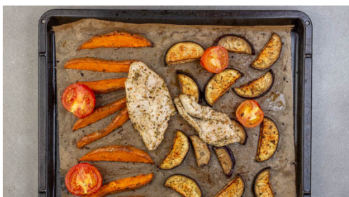
4. Fleisch und Gemüse backen

Das Fleisch trocken tupfen und quer halbieren. Die Tomaten halbieren. Das Fleisch und die Tomaten mit 1EL Olivenöl beträufeln und mit der restlichen Gewürzmischung sowie je 1 Prise Salz und Pfeffer würzen.