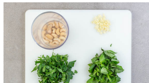
5. Creme vorbereiten

Das Fleisch und die Tomaten nach ca. 20Min. Garzeit zu dem Gemüse auf das Backblech geben und im Ofen 10-15Min. backen, bis das Fleisch gar und das Gemüse appetitlich gebräunt ist.