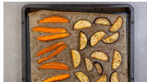
2. Gemüse backen

Den Backofen auf 220°C (200°C Umluft) vorheizen. Die Süßkartoffel samt Schale längs halbieren und in ca. 1cm dicke Spalten schneiden. Die Aubergine längs halbieren und in ca. 0,5cm dicke Scheiben schneiden. Das Gemüse auf ein mit Backpapier ausgelegtes Backblech geben.