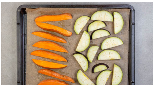
1. Gemüse schneiden

Energie 647kcal, Fett 40.4g, Kohlenhydrate 34.4g, Eiweiß 35.3g