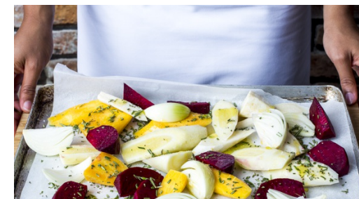
3. Gemüse rösten

Inzwischen das Fleisch mit etwas Küchenkrepp trocken tupfen und in einer großen Pfanne mit 1-2EL Olivenöl bei mittlerer Hitze auf jeder Seite 2-3Min. anbraten. Je nach Dicke der Steaks die Garzeit etwas verlängern, bis das Fleisch durch ist. Mit Salz und Pfeffer würzen und noch 2-3Min. ohne Hitzezufuhr in der Pfanne ruhen lassen.