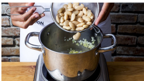
4. Bohnen kochen

Den Backofen auf 220°C Umluft (240°C Ober-/Unterhitze) vorheizen. Die Zwiebeln schälen und halbieren. 3 Zwiebelhälften in feine Würfel, die übrigen 3 Hälften in breite Spalten schneiden. Die Rosmarinnadeln abzupfen und grob hacken. Die Bohnen in einem Sieb mit kaltem Wasser abspülen und gut abtropfen lassen.