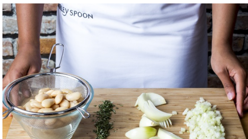
1. Zwiebeln schneiden

Energie 569kcal, Fett 21.9g, Kohlenhydrate 43.8g, Eiweiß 46.3g