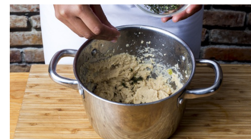
6. Bohnen pürieren

Die Zwiebelspalten , die Rote Bete , die Karotten und die Petersilienwurzeln auf ein mit Backpapier belegtes Backblech geben und mit dem gehackten Rosmarin , 1-2EL Olivenöl sowie Salz, Pfeffer und 1 Prise Zucker vermengen. Das Gemüse gleichmäßig verteilen und für 10-15Min. im Ofen rösten.