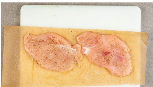
2. Fleisch klopfen

Die Petersilie samt Stängeln fein hacken. Die Zitrone in Spalten schneiden. Für das Dressing 2EL Pflanzenöl, 1EL Essig, 1TL Senf, den Saft aus 1 Zitronenspalte und je 1 Prise Salz, Pfeffer und Zucker verrühren, dann die ½ der Petersilie untermengen.