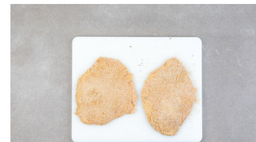
3. Schnitzel panieren

Die Schnitzel in einer großen Pfanne mit 2EL Pflanzenöl bei mittlerer bis starker Hitze auf jeder Seite 2-3Min. braten, bis die Panade goldgelb und knusprig ist. Tipp: Wer mag, kann statt Öl auch 1-2EL Butter verwenden. Die Schnitzel aus der Pfanne nehmen und auf etwas Küchenkrepp abtropfen lassen.