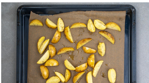
1. Kartoffeln rösten

Energie 1001kcal, Fett 47.0g, Kohlenhydrate 72.7g, Eiweiß 67.7g