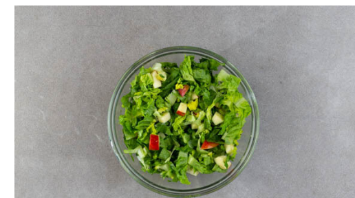
6. Salat zubereiten

Auf tiefen Tellern 1EL Weizenmehl, 1 verquirltes Ei sowie die Semmelbrösel bereitstellen. Die Schnitzel von beiden Seiten mit je 1 Prise Salz und Pfeffer würzen und der Reihe nach im Mehl, im Ei und in den Semmelbröseln wenden. Dabei darauf achten, dass alles gleichmäßig bedeckt ist und die Panade ggf. noch leicht andrücken.