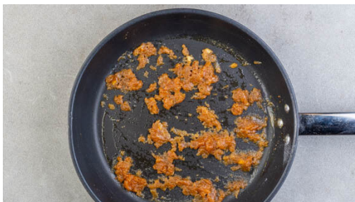
5. Sauce ansetzen

Inzwischen den Brokkoli in mundgerechte Röschen schneiden, mit 1EL Pflanzenöl, 1EL Balsamicoessig und 1 kräftigen Prise Salz vermengen, in eine Auflaufform geben und 12-14Min. im Ofen backen, bis Röstmarken entstehen.