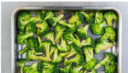
2. Brokkoli backen

Das Fleisch trocken tupfen und längs halbieren, dann mit der ½ der Gewürzmischung und 1 Prise Salz einreiben. In der Pfanne mit 1EL Pflanzenöl bei mittlerer Hitze auf jeder Seite 2-3Min. goldbraun anbraten. Aus der Pfanne nehmen und beiseitestellen.