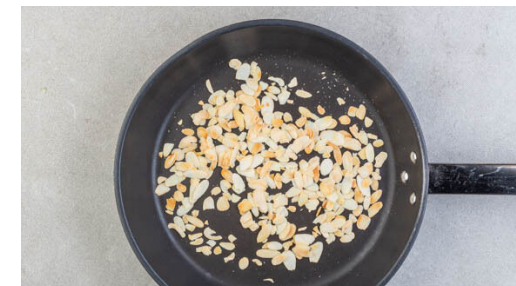
3. Mandeln anrösten

1EL Butter in der Pfanne bei mittlerer bis starker Hitze erwärmen. 1EL Mehl und das Chutney in die geschmolzene Butter geben und ca. 1Min. rühren, dann die restliche Gewürzmischung und die ½ des Brühgewürzes unterrühren.