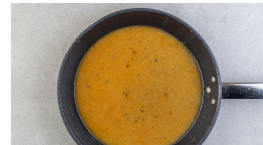
6. Sauce fertigstellen

Die Mandelblättchen in einer mittelgroßen Pfanne ohne Zugabe von Fett bei mittlerer Hitze 1-2Min. goldbraun anrösten. Vorsicht , sie können schnell zu dunkel werden. Zum Abkühlen aus der Pfanne nehmen und beiseitestellen.