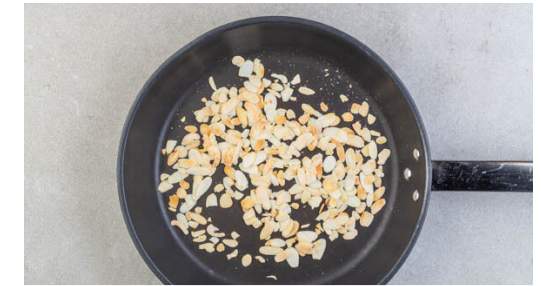
3. Mandeln anrösten

2EL Butter in der Pfanne bei mittlerer bis starker Hitze erwärmen. 2EL Mehl und das Chutney in die geschmolzene Butter geben und ca. 1Min. rühren, dann die restliche Gewürzmischung und die ½ des Brühgewürzes unterrühren.