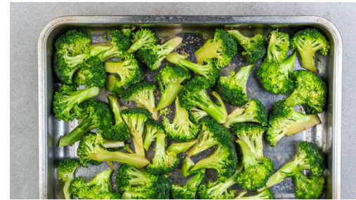
2. Brokkoli backen

Das Fleisch trocken tupfen und längs halbieren, dann mit der ½ der Gewürzmischung und 1 kräftigen Prise Salz einreiben. In der Pfanne mit 2EL Pflanzenöl bei mittlerer Hitze auf jeder Seite 2-3Min. goldbraun anbraten. Aus der Pfanne nehmen und beiseitestellen.