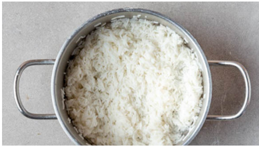
1. Reis kochen

Energie 812kcal, Fett 33.1g, Kohlenhydrate 80.1g, Eiweiß 42.8g