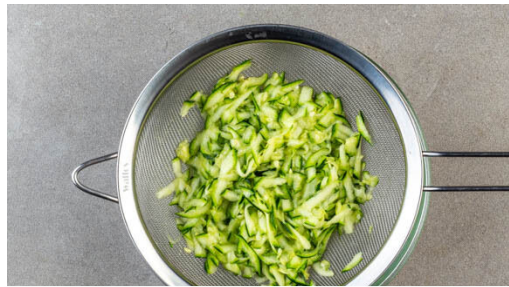
1. Zucchini vorbereiten

Energie 959kcal, Fett 36.0g, Kohlenhydrate 109.2g, Eiweiß 43.4g