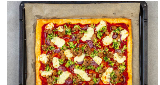
6. Pizza backen

Die übrige Knoblauchzehe schälen und fein würfeln, mit dem Tomatenmark , 2EL Olivenöl, 1TL Essig und 2EL Wasser zu einer Sauce verrühren und mit Salz und Pfeffer würzen.