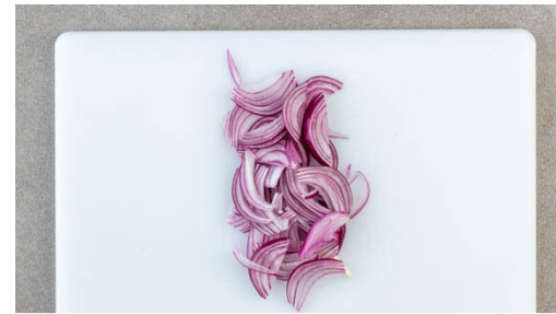
2. Zwiebel schneiden

Den Teig mit dem Papier nach unten auf einem Backblech ausrollen und vorsichtig flach drücken, bis er die gesamte Größe des Blechs einnimmt.