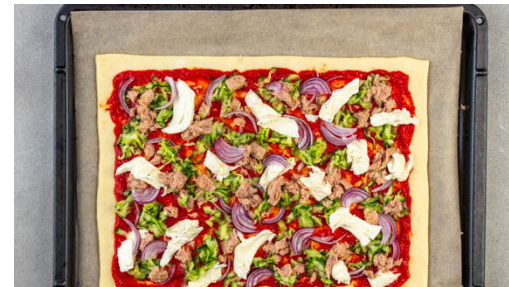
5. Pizza belegen

Die ½ der Zwiebel schälen und in feine Streifen schneiden. Die übrige Hälfte wird für dieses Rezept nicht benötigt.