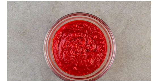
3. Pizzasauce anrühren

Den Thunfisch abgießen und mit einer Gabel zerkrümeln. Die Tomatensauce gleichmäßig auf dem Teig verstreichen, dabei einen Rand von ca. 1cm frei lassen. Die Zucchini ausdrücken, um überschüssiges Wasser zu entfernen, und mit dem Thunfisch und den Zwiebeln auf der Pizza verteilen. Den Mozzarella grob zerpfücken und auf die Pizza legen, mit 1 Prise Salz würzen.