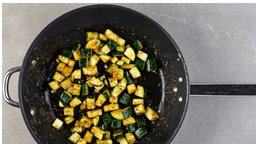
1. Zucchini braten

Energie 1182kcal, Fett 63.9g, Kohlenhydrate 97.0g, Eiweiß 50.6g