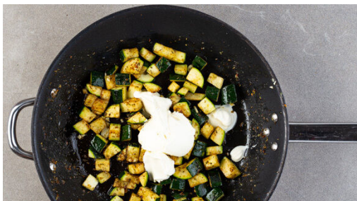
2. Sauce vorbereiten

Die Pasta in das kochende Wasser geben und ca. 6Min. kochen lassen. Die Pasta soll noch nicht ganz gar sein. In ein Sieb abgießen, abtropfen lassen und zurück in den Topf geben.