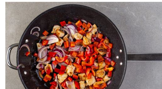
3. Gemüse und Fleisch braten

Die Zucchini mit einem Stabmixer pürieren. Die Sauce ggf. mit etwas Wasser verdünnen und mit Salz und Pfeffer abschmecken, dann mit der Gemüse-Fleisch-Mischung unter die Pasta mengen. Die Pasta in eine Auflaufform geben. Den Feta mit den Fingern grob zerkrümeln, auf der Pasta verteilen und die Pasta ca. 10Min. im Ofen überbacken.