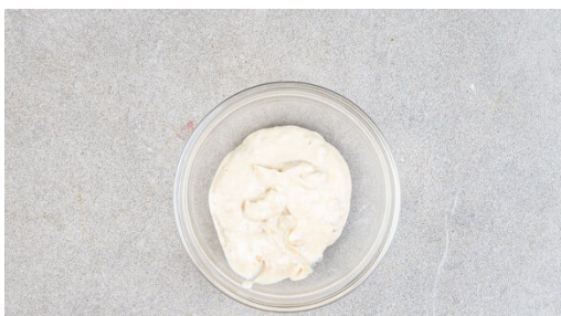
4. Tahinisaucen zubereiten

Die Tomaten in ca. 2cm große Würfel schneiden und mit der Sriracha-Sauce , 1EL hellem Essig sowie je 1 Prise Salz und Pfeffer vermengen. Tipp: Wenn Kinder mitessen, die Sriracha-Sauce ggf. weglassen und nur die eigene Portion zum Servieren verfeinern.