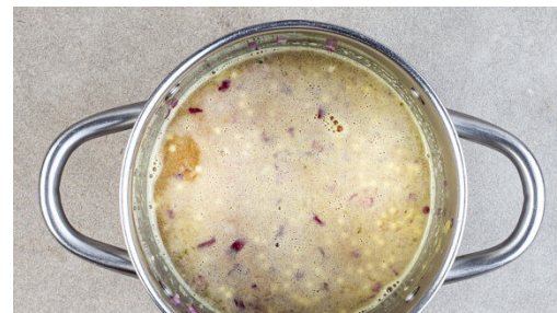
2. Perlencouscous garen

Die Zwiebel schälen, halbieren und fein würfeln. Die ½ des Brühgewürzes oder mehr nach Geschmack in 400ml heißem Wasser auflösen. Die Zwiebelwürfel in einem kleinen Topf mit 1EL Olivenöl bei mittlerer Hitze ca. 1Min. unter Rühren anbraten.