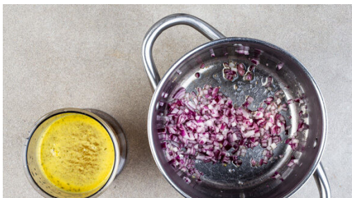
1. Zwiebel braten

Energie 1267kcal, Fett 73.7g, Kohlenhydrate 117.0g, Eiweiß 32.1g