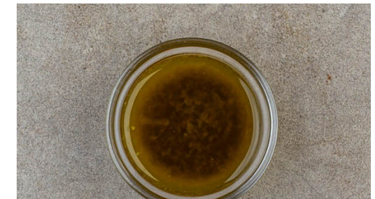
6. Dressing zubereiten

Die Hollandaise-Päckchen in das kochende Wasser geben und 3-4Min. erhitzen.