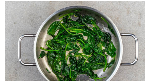
2. Spinat garen

Den Backofen auf 240°C (220°C Umluft) vorheizen. Den Knoblauch schälen und durch eine Knoblauchpresse drücken oder sehr fein würfeln. Den Schnittlauch in kleine Röllchen schneiden.