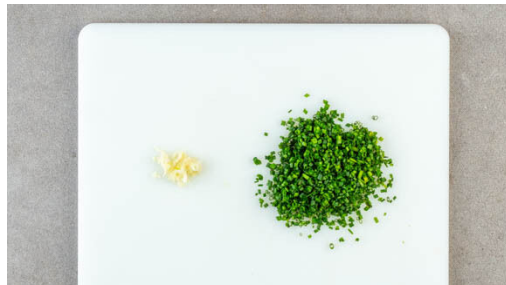
1. Zutaten vorbereiten

Energie 529kcal, Fett 43.3g, Kohlenhydrate 20.2g, Eiweiß 13.4g