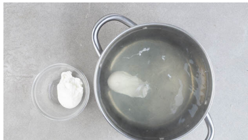
4. Eier pochieren

Die Brötchen aufschneiden und mit den Schnittflächen nach oben auf ein mit Backpapier ausgelegtes Backblech geben. Im Ofen in 4-5Min. goldbraun toasten. Inzwischen in einem zweiten mittelgroßen Topf Wasser für die Hollandaise zum Kochen bringen.