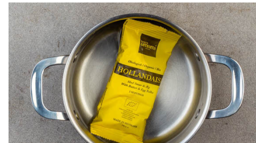
5. Sauce erhitzen

In einem dritten mittelgroßen Topf ausreichend Wasser für die Eier mit 1EL hellem Essig aufkochen, dann die Hitze reduzieren. Die Eier einzeln aufschlagen und in das Wasser geben. Ca. 3Min. pochieren, bis das Eiweiß fest und das Eigelb noch flüssig ist. Mit einer Schaumkelle herausnehmen und auf Küchenkrepp legen.