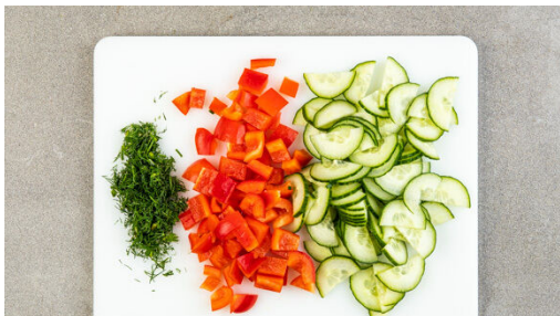
4. Gemüse schneiden

Den Lauch längs halbieren, dann in dünne Streifen schneiden. In einer großen Pfanne mit 1EL Pflanzenöl und 1 Prise Salz bei mittlerer Hitze ca. 2Min. anbraten, bis der Lauch weich wird. In eine große Schüssel umfüllen. Die Pfanne auswaschen und beiseitestellen.