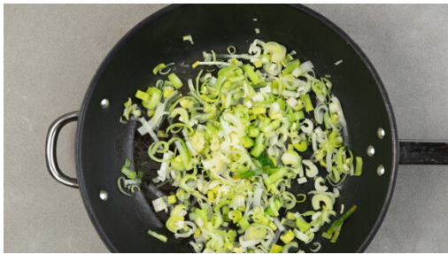
1. Lauch garen

Energie 975kcal, Fett 49.8g, Kohlenhydrate 109.2g, Eiweiß 17.1g