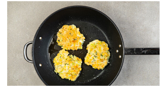
3. Bratlinge ausbacken

Die Gurke , die Paprika und den restlichen Mais mit 2EL Essig vermengen und den Salat mit Salz und Pfeffer abschmecken.