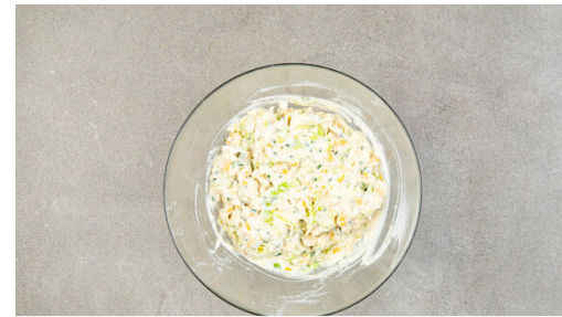
2. Teig zubereiten

Nebenher die Gurke längs halbieren und in dünne Scheiben schneiden. Die Paprika vierteln, entkernen und in ca. 2cm große Stücke schneiden.