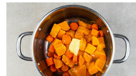
6. Gemüse stampfen

Die Tomaten und die Lauchzwiebeln mit 2TL Essig vermengen. Mit Salz, Pfeffer und Zucker abschmecken.