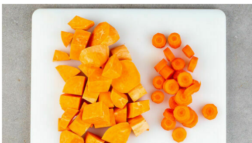
1. Gemüse schneiden

Energie 420kcal, Fett 13.5g, Kohlenhydrate 36.8g, Eiweiß 32.9g