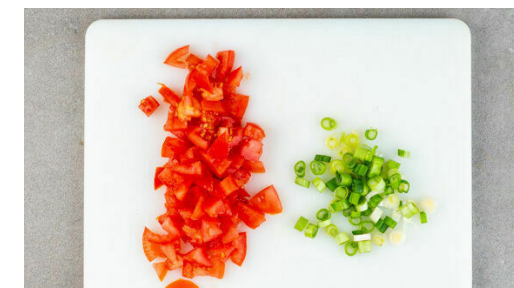
3. Salsa vorbereiten

Die Süßkartoffelwürfel und die Karottenscheiben in das kochende Wasser geben und in 10-12Min. gar kochen.