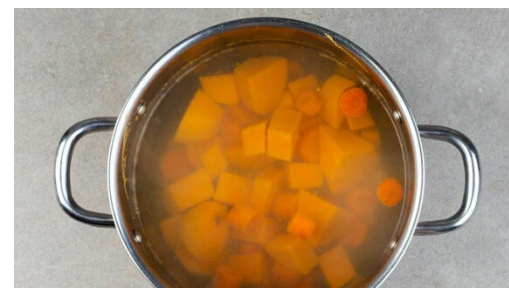
2. Gemüse kochen

In einem großen Topf ausreichend gesalzenes Wasser für das Gemüse zum Kochen bringen. Die Süßkartoffeln schälen und in ca. 2cm große Würfel schneiden. Die Karotten ggf. schälen und in ca. 2cm dicke Scheiben schneiden.