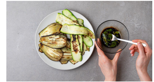
3. Gemüse braten

1 Oreganostängel mit 3EL Wasser, 1-2EL Balsamicoessig und 1-2TL Zucker sowie Salz und Pfeffer in die Pfanne geben und die Sauce bei mittlerer Hitze etwas einkochen lassen. Die Pfanne vom Herd nehmen, das Fleisch samt Bratensaft zurück in die Pfanne geben, gut in der Sauce wenden und anschließend den Oreganostängel entfernen.