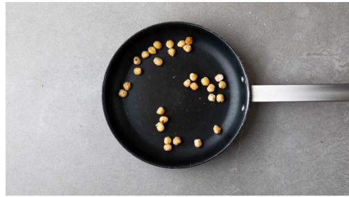
1. Haselnüsse anrösten

Vergiss nicht, das Gemüse vor der Zubereitung gründlich zu waschen, insbesondere grünes Blattgemüse und Salate.