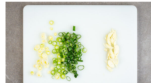
3. Lauchzwiebeln schneiden

Die Lauchzwiebeln in dünne Ringe schneiden, den weißen und grünen Teil separat aufbewahren. Den Knoblauch schälen und in hauchdünne Scheibchen schneiden.