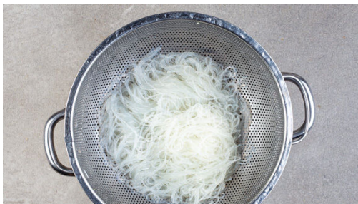
2. Nudeln garen

In einem kleinen Topf ausreichend gesalzenes Wasser für die Nudeln aufkochen. Das Fleisch trocken tupfen, in 2-3cm große Stücke schneiden und mit je 1 Prise Salz und Pfeffer würzen. Das Fleisch in einer mittelgroßen Pfanne mit 1EL Pflanzenöl bei mittlerer bis starker Hitze 2-3Min. anbraten, dabei gelegentlich wenden.