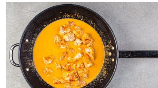
3. Curry zubereiten

Die Nudeln in das kochende Wasser geben, den Topf vom Herd nehmen und die Nudeln 3-5Min. gar ziehen lassen. In ein Sieb abgießen, kalt abschrecken und abtropfen lassen. Tipp: Um die Weiterverarbeitung zu erleichtern, ggf. die Nudeln mit einer sauberen Schere 1-2 Mal durchschneiden.