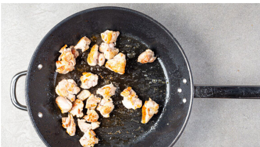
1. Fleisch anbraten

Energie 1026kcal, Fett 64.1g, Kohlenhydrate 73.3g, Eiweiß 38.0g