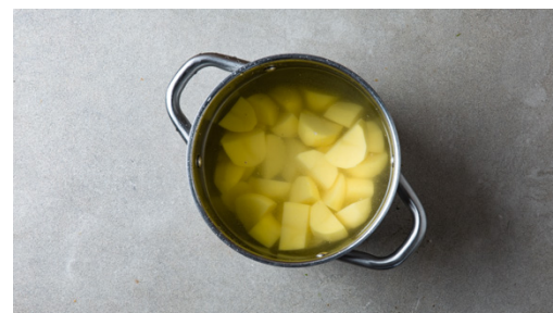
2. Kartoffeln kochen

Die Zwiebel schälen, halbieren und in feine Würfel schneiden. 1EL Butter in einer großen Pfanne bei mittlerer Hitze schmelzen, dann die Zwiebeln 1-2Min. glasig anschwitzen. Die Pfanne beiseitestellen und die Zwiebeln abkühlen lassen.