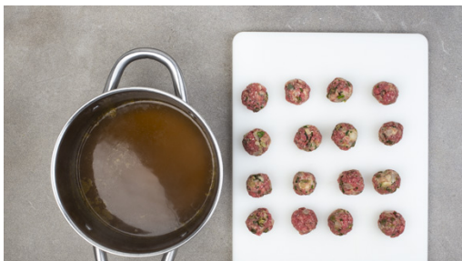
4. Klopse zubereiten

In einem weiteren mittelgroßen Topf ca. 1L Wasser aufkochen und das Brügewürz darin auflösen. Die ½ der Semmelbrösel mit ca. 50ml Wasser in einer Schüssel verrühren. Die Petersilienblätter von den Stängeln zupfen und fein hacken. Die ½ der Kapern grob hacken.