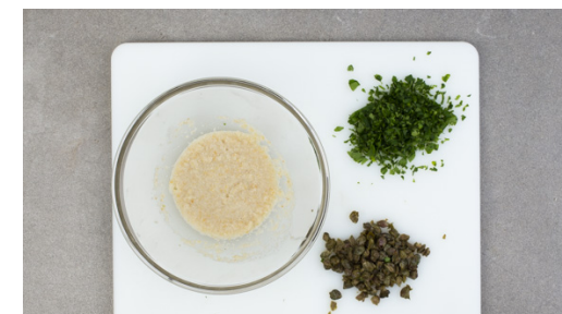
3. Zutaten vorbereiten

In einem mittelgroßen Topf ausreichend gesalzenes Wasser für die Kartoffeln aufsetzen. Die Kartoffeln schälen, größere Kartoffeln halbieren. Sobald das Wasser kocht, die Kartoffeln hineingeben und bei mittlerer Hitze in 15-20Min. gar kochen. Tipp: Die Kartoffeln sind durch, wenn sie sich bei der Messerprobe leicht vom Messer lösen. In ein Sieb abgießen.