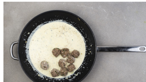
5. Sauce zubereiten

Das Hackfleisch mit der ½ der Zwiebeln , den Semmelbröseln , der ½ der Petersilie , den gehackten Kapern sowie Salz und Pfeffer gut vermengen, dann 2-3cm große Klopse formen. Diese vorsichtig in die Brühe geben und bei niedriger Hitze in 15-20Min. gar ziehen lassen. Wichtig: Die Brühe darf nur sieden, nicht kochen!