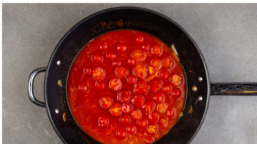
4. Tomatensauce zubereiten

In einem Wasserkocher 1,5L Wasser zum Kochen bringen. Den Sellerie vierteln, mit einem Messer schälen und in 1-2cm große Stücke schneiden. In einem mittelgroßen Topf mit dem kochenden Wasser bedecken und ½TL Salz hinzugeben. Das Wasser erneut zum Kochen bringen und den Sellerie abgedeckt in ca. 15Min. weich kochen.