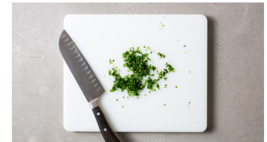
6. Petersilie hacken

Die Orangenschale abreiben, dann die Orange halbieren und auspressen. Den Knoblauch schälen und in feine Scheibchen schneiden. Den Fisch jeweils auf ein Stück Alufolie legen. Mit insgesamt ½TL Olivenöl beträufeln und mit je 1 Prise Salz und Pfeffer würzen. Die Orangenschale und den Knoblauch über den Fisch streuen und die Alufolie zu luftdichten Paketen falten.