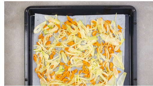
2. Gemüse backen

Die Fisch-Päckchen zu dem Gemüse auf das Backblech geben und die letzten 6-8Min. der Garzeit mitbacken. Das Gemüse nach dem Backen mit 1-2EL Orangensaft beträufeln.