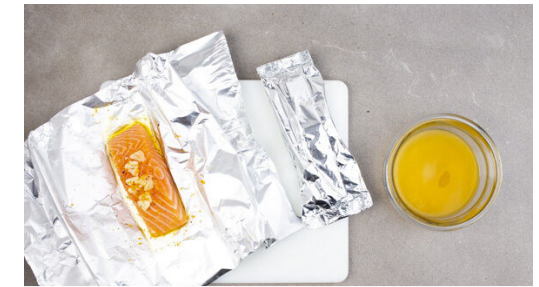
3. Fisch vorbereiten

Die ½ der Oreganoblättchen abzupfen und fein schneiden. Den Feta mit den Fingern über den gebackenen Kartoffeln zerkrümeln und mit dem Oregano vermengen.