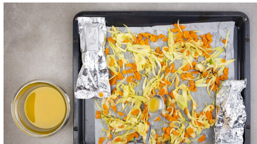
4. Fisch backen

Den Backofen auf 210°C (190°C Umluft) vorheizen. Die Kartoffeln samt Schale in dünne Scheiben schneiden, mit 1EL Olivenöl sowie je ½TL Salz und Pfeffer vermengen und auf einem mit Backpapier ausgelegten Backblech verteilen. Im Ofen 25-30Min. backen, bis die Kartoffeln gar und goldbraun sind. Den Fisch kalt abspülen, trocken tupfen und evtl. vorhandene Gräten und Schuppen entfernen.