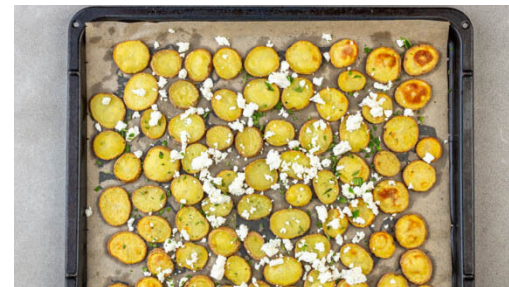
5. Kartoffeln verfeinern

Den Fenchel der Länge nach vierteln, dann in dünne Streifen schneiden, dabei den harten Strunk entfernen. Die Karotte ggf. schälen, längs halbieren und schräg in dünne Scheiben schneiden. Das Gemüse mit 1EL Olivenöl und je 1 kräftigen Prise Salz und Pfeffer auf einem zweiten mit Backpapier ausgelegten Backblech vermengen und in 15-20Min. im Ofen goldbraun backen.