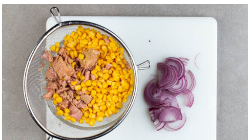
1. Zutaten vorbereiten

Energie 624kcal, Fett 20.3g, Kohlenhydrate 72.1g, Eiweiß 34.6g