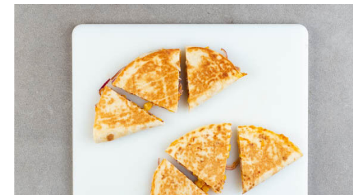
6. Quesadillas schneiden

Inzwischen die Gurke längs halbieren und quer in ca. 0,5cm dünne Scheiben schneiden. Den übrigen Mais abtropfen lassen. 1TL Mayonnaise mit ½TL Essig verrühren, dann mit den Gurken und dem übrigen Mais vermengen.