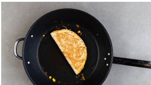
4. Mehr Quesadillas braten

1 Tortilla in eine große Pfanne geben und 2-3EL Thunfischfüllung auf einer Seite der Tortilla verteilen, die andere Seite darüber falten. Den Vorgang mit einer weiteren Tortilla wiederholen und beide Quesadillas gleichzeitig bei niedriger bis mittlerer Hitze 4-6Min. von jeder Seite braten, bis sie goldbraun sind und der Käse geschmolzen ist.