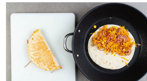
3. Quesadillas braten

Den Thunfisch , den abgetropften Mais , die Zwiebeln , den Käse und die ½ der Gewürzmischung vermengen und mit je 1 kräftigen Prise Salz und Pfeffer würzen.