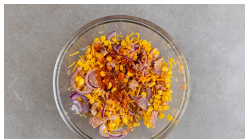
2. Füllung zubereiten

Den Thunfisch in ein Sieb abgießen und abtropfen lassen. Die ½ des Maises dazugeben und ebenfalls abtropfen lassen. Die Zwiebel schälen, halbieren und in feine Streifen schneiden.