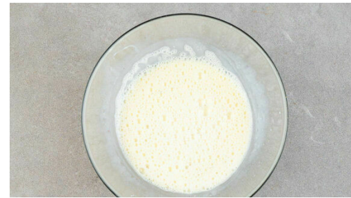
2. Guss anrühren

Die Brötchen in ca. 2cm große Würfel schneiden. Den Käse fein hacken. Den Schnittlauch in kleine Ringe schneiden und mit den Brotwürfeln und der ½ des Käses vermengen.