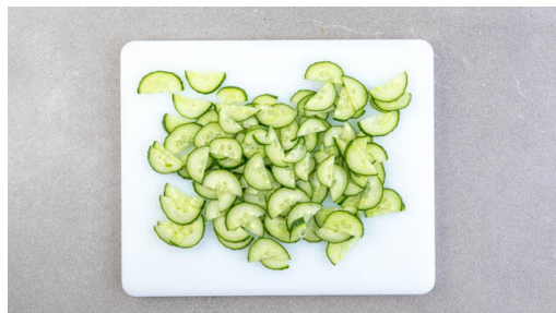
4. Salat vorbereiten

Eine Auflaufform mit 1EL Pflanzenöl fetten. Die Brotmischung darin verteilen, leicht andrücken und mit der Eier-Milch-Mischung übergießen. Mit dem restlichen Käse bestreuen und gut abgedeckt bis zu 24 Stunden kalt stellen.