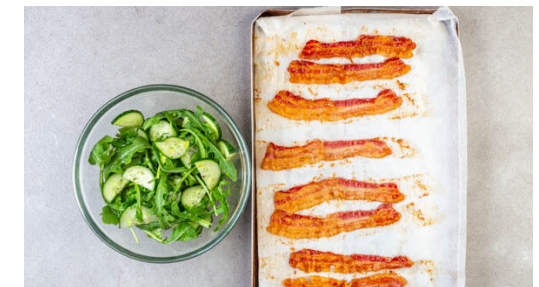
6. Bacon & Salat zubereiten

Ca. 45Min. vor dem Servieren den Backofen auf 220°C (200°C Umluft) vorheizen. Den Auflauf zunächst mit Alufolie abgedeckt im Ofen ca. 20Min. backen, dann die Alufolie entfernen und den Auflauf weitere 10-15Min. backen, bis er golden gebräunt und innen nicht mehr flüssig ist.