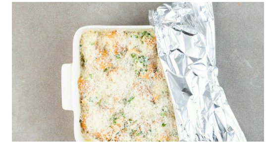
3. Auflauf kalt stellen

Die Eier mit 200ml Milch und je ½TL Salz und Pfeffer verquirlen.