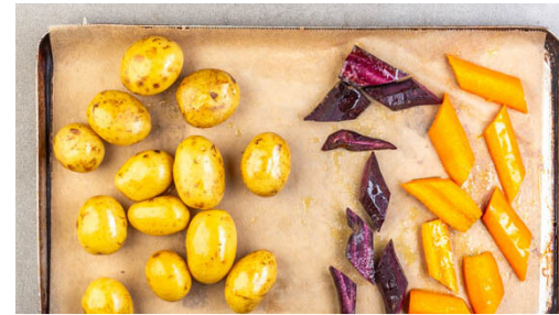
2. Gemüse rösten

Den Backofen auf 220°C (200°C Umluft) vorheizen. Die Zwiebel schälen, halbieren und fein würfeln, dann in einer großen Pfanne mit 2EL Olivenöl und 1 kräftigen Prise Salz bei mittlerer Hitze in 3-5Min. glasig braten, dabei gelegentlich umrühren. Die Pfanne vom Herd nehmen und abkühlen lassen.