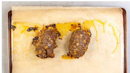
4. Hackbraten backen

Währenddessen das Hackfleisch mit den Semmelbröseln , den Zwiebeln , der Gewürzmischung , 2EL Ketchup und 1 Ei verkneten. Aus der Hackmasse insgesamt 4 kleine Laibe formen und auf ein zweites mit Backpapier ausgelegtes Backblech legen.