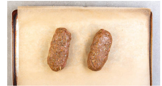
3. Hackbraten vorbereiten

Die Karotten ggf. schälen, längs halbieren und schräg vierteln, dann auf einem mit Backpapier ausgelegtem Backblech mit 2EL Olivenöl und je ½TL Salz und Pfeffer vermengen. Die Kartoffeln daneben mit 2EL Olivenöl und je ½TL Salz und Pfeffer vermengen. Das Gemüse im Ofen 15-20Min. rösten.