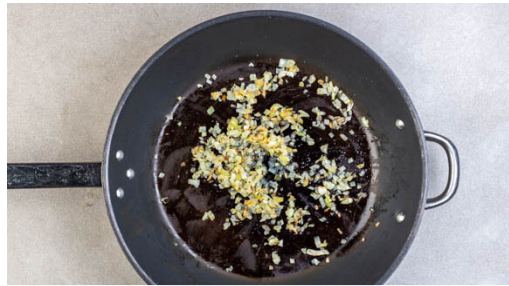
1. Zwiebeln braten

Energie 819kcal, Fett 44.3g, Kohlenhydrate 65.5g, Eiweiß 34.5g