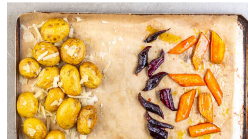
5. Gemüse verfeinern

Wenn das Gemüse 15-20Min. gebacken hat, das Blech mit den Hackbraten über dem Gemüse positionieren und die Hackbraten in 15-18Min. goldbraun und gar backen.