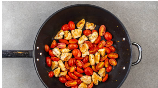
4. „Hähnchen“ braten

In einem großen Topf ausreichend gesalzenes Wasser für die Pasta zum Kochen bringen. Die Walnüsse in einer großen Pfanne bei mittlerer Hitze ohne Zugabe von Fett 1-2Min. anrösten. Vorsicht , sie können schnell zu dunkel werden. Zum Abkühlen auf einem Teller beiseitestellen, die Pfanne aufbewahren.