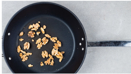
1. Walnüsse anrösten

Energie 785kcal, Fett 34.1g, Kohlenhydrate 79.8g, Eiweiß 32.0g