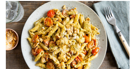
6. Anrichten und servieren

Die Tomaten halbieren. Die Pasta in das kochende Wasser geben und in 7-9Min. bissfest kochen. Mit einem Messbecher ca. 150ml Pastawasser abschöpfen, dann die Pasta in ein Sieb abgießen, zurück in den Topf geben und warm halten.