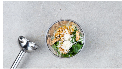
2. Pesto zubereiten

Das „ Hähnchen “ in der Pfanne mit 2EL Olivenöl bei starker Hitze 2-3Min. scharf anbraten. Dann die Tomaten dazugeben und 1-2Min. bei mittlerer Hitze mitbraten. Mit Salz und Pfeffer abschmecken.