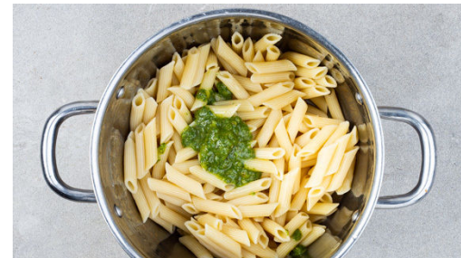
5. Pasta fertigstellen

Das Basilikum samt Stängeln grob schneiden und in ein hohes Gefäß geben. Die ½ des Käses, ¾ der Walnüsse und 3EL Olivenöl zu dem Basilikum geben und alles mit einem Stabmixer zu einem cremigen Pesto pürieren. Mit Salz und Pfeffer abschmecken.