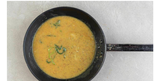
6. Sauce zubereiten

Eine große Pfanne bis zum Rauchpunkt erhitzen und 2EL Pflanzenöl hineingeben. Das Fleisch auf jeder Seite 1-2Min. anbraten. Dann herausnehmen, in eine mittelgroße Auflaufform geben und in 5-7Min. im Ofen fertig garen. Für die Sauce die Hitze reduzieren und die Zwiebeln und den Salbei in der Pfanne mit 1EL Pflanzenöl bei mittlerer Hitze 3-4Min. anschwitzen.