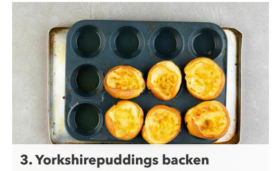
3. Yorkshirepuddings backen

Die Zwiebel schälen und fein würfeln. Den Rosenkohl halbieren, auf einem mit Backpapier ausgelegten Backblech mit 1EL Pflanzenöl und je 1 kräftigen Prise Salz, Pfeffer und Zucker vermengen und im Ofen in 10-12Min. knusprig rösten.