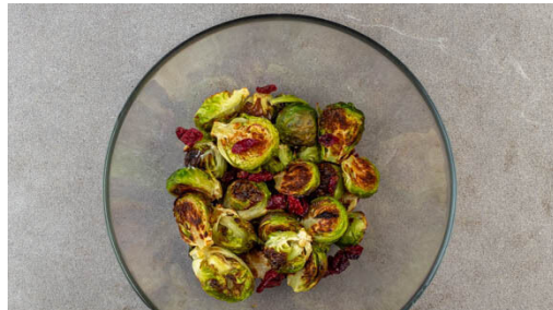
4. Rosenkohl verfeinern

Das Blech mit der Muffin-Backform vorsichtig aus dem Ofen nehmen und die 12 vorbereiteten Mulden jeweils etwa zur Hälfte bzw. bis zu zwei Dritteln mit dem Teig befüllen. Auf der untersten Schiene 20-25Min. backen, bis die Yorkshirepuddings aufgegangen, goldbraun und in der Mitte nicht mehr feucht sind.