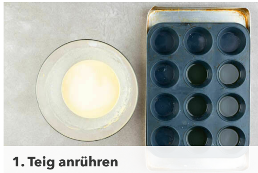
1. Teig anrühren

Energie 823kcal, Fett 48.2g, Kohlenhydrate 49.5g, Eiweiß 45.6g