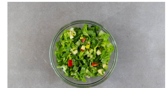
6. Salat zubereiten

Die Schnitzel in einer großen Pfanne mit 2EL Pflanzenöl bei mittlerer bis starker Hitze auf jeder Seite 2-3Min. braten, bis die Panade goldgelb und knusprig ist. Tipp: Wer mag, kann statt Öl auch 1-2EL Butter verwenden. Die Schnitzel aus der Pfanne nehmen und auf etwas Küchenkrepp abtropfen lassen.