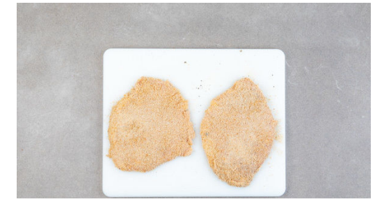
3. Schnitzel panieren

Das Fleisch trocken tupfen, dann zwischen zwei Lagen Frischhaltefolie mit einem Fleischklopfer oder dem Boden einer schweren Pfanne flach klopfen.