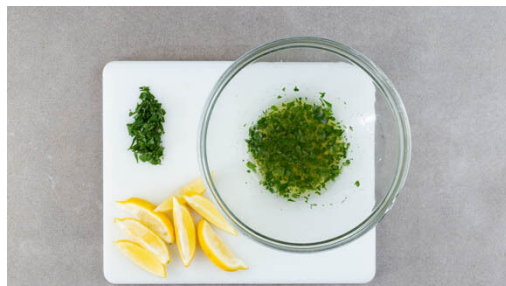
4. Zutaten vorbereiten

Auf tiefen Tellern 1EL Weizenmehl, 1 verquirltes Ei sowie die Semmelbrösel bereitstellen. Die Schnitzel von beiden Seiten mit je 1 Prise Salz und Pfeffer würzen und der Reihe nach im Mehl, im Ei und in den Semmelbröseln wenden. Dabei darauf achten, dass alles gleichmäßig bedeckt ist und die Panade ggf. noch leicht andrücken.