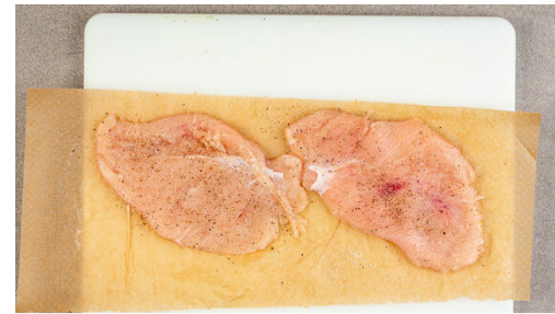
2. Fleisch klopfen

Den Backofen auf 220°C (200°C Umluft) vorheizen. Die Kartoffeln samt Schale je nach Größe vierteln oder achtern und auf einem mit Backpapier ausgelegten Backblech mit 1EL Pflanzenöl und je 1 kräftigen Prise Salz und Pfeffer vermengen. Im Ofen 25-30Min. rösten, bis die Kartoffeln goldbraun und knusprig sind.