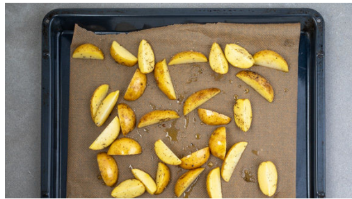
1. Kartoffeln rösten

Energie 1001kcal, Fett 47.0g, Kohlenhydrate 72.7g, Eiweiß 67.7g