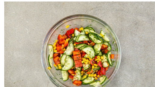
5. Salat zubereiten

Den Mais in ein Sieb abgießen und abtropfen lassen. Die ½ des Maises und das Mehl zum Lauch geben und gut vermengen. Die Haferkochcreme , die ½ der Gewürzmischung und je 1 kräftige Prise Salz und Pfeffer hinzufügen und untermengen.