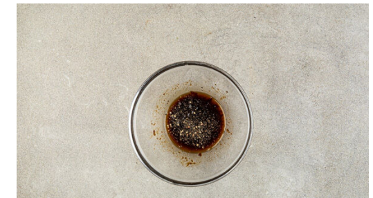
6. Dip zubereiten

In der Pfanne 1EL Pflanzenöl bei mittlerer Hitze erwärmen. 2-3EL Teig portionsweise für jeden Bratling in die Pfanne geben und auf diese Weise je nach Größe der Pfanne mehrere Bratlinge gleichzeitig backen. Die Bratlinge 3-4Min. garen, dann wenden und weitere 3-4Min. backen. Ggf. die Hitze reduzieren und etwas mehr Öl hinzugeben. Auf diese Weise ca. 6 Bratlinge zubereiten.