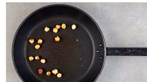
3. Nüsse anrösten

Die Pfanne vom Herd nehmen und die Steaks mit der Balsamicocreme beträufeln, dabei wenden, um es gleichmäßig zu glasieren. Mit ½TL Salz und 1 kräftigen Prise Pfeffer würzen und bis zum Servieren auf einem Teller abgedeckt ruhen lassen.