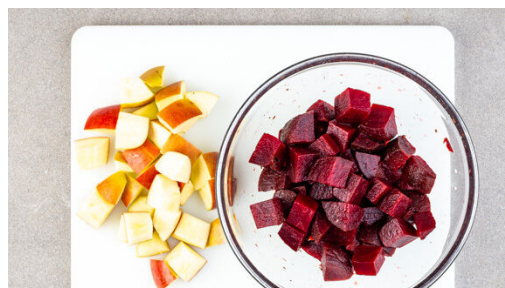
2. Salat vorbereiten

Die veganen Steaks trocken tupfen und mit je 1 kräftigen Prise Salz und Pfeffer einreiben. Die veganen Steaks in derselben Pfanne mit 2EL Olivenöl bei mittlerer Hitze auf beiden Seiten 3-4Min. goldbraun braten.