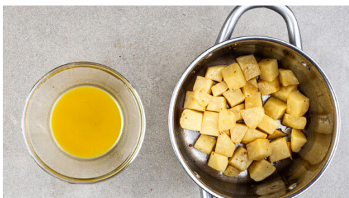
1. Sellerie kochen

Energie 557kcal, Fett 26.9g, Kohlenhydrate 37.8g, Eiweiß 35.8g