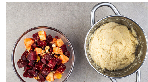
6. Püree zubereiten

Die Haselnüsse in einer großen Pfanne ohne Zugabe von Fett bei mittlerer Hitze 1-2Min. goldbraun anrösten. Vorsicht , sie können schnell zu dunkel werden. Zum Abkühlen aus der Pfanne nehmen und grob hacken.