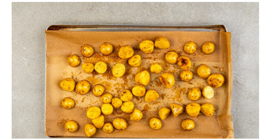
3. Kartoffeln backen

1EL Olivenöl, 1EL Essig, 1TL Senf und 1TL Honig zu einem Dressing verrühren und mit Salz und Pfeffer abschmecken. Die Gurke längs halbieren, in dünne Scheiben schneiden und mit dem Dressing vermengen.