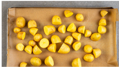
1. Kartoffeln schneiden

Energie 679kcal, Fett 38.7g, Kohlenhydrate 48.0g, Eiweiß 34.1g