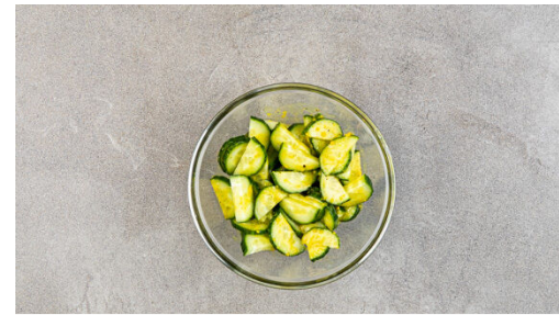
2. Gurkensalat zubereiten

Den Backofen auf 220°C (200°C Umluft) vorheizen. Die Kartoffeln samt Schale je nach Größe halbieren oder vierteln und auf ein mit Backpapier ausgelegtes Backblech geben.