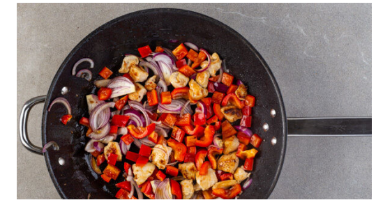
3. Gemüse und Fleisch braten

Die Zucchini mit einem Stabmixer pürieren. Die Sauce ggf. mit etwas Wasser verdünnen und mit Salz und Pfeffer abschmecken, dann mit der Gemüse-Fleisch-Mischung unter die Pasta mengen. Die Pasta in eine Auflaufform geben. Den Feta mit den Fingern grob zerkrümeln, auf der Pasta verteilen und die Pasta ca. 10Min. im Ofen überbacken.