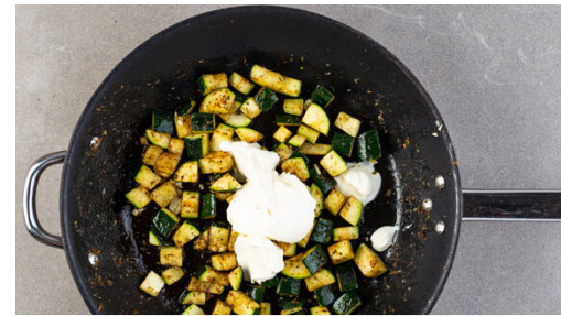
2. Sauce vorbereiten

Die Pasta in das kochende Wasser geben und ca. 6Min. kochen lassen. Die Pasta soll noch nicht ganz gar sein. In ein Sieb abgießen, abtropfen lassen und zurück in den Topf geben.