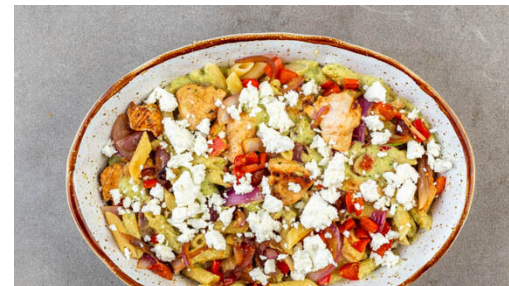
5. Gratin backen

Die Crème fraîche unterrühren und die Zucchini abgedeckt bei mittlerer Hitze noch ca. 5Min. garen. Dann in ein hohes Püriergefäß füllen, die Pfanne auswaschen.