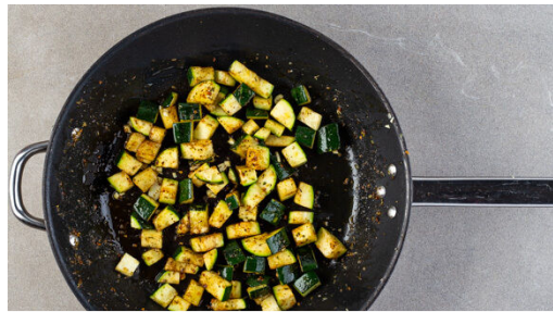
1. Zucchini braten

Energie 1218kcal, Fett 67.7g, Kohlenhydrate 97.3g, Eiweiß 51.0g