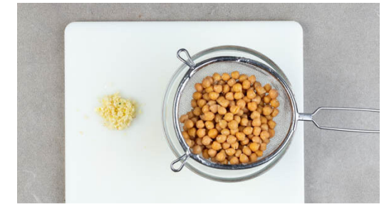
3. Kichererbsen vorbereiten

Die Karotten mit 2EL Olivenöl und der Petersilie vermengen und mit je 1 kräftigen Prise Salz und Pfeffer würzen. Auf einem Backblech verteilen und 10-15Min. im Ofen rösten, bis die Karotten leicht gebräunt sind.