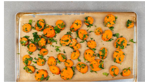
2. Karotten rösten

Den Backofen auf 200°C (180°C Umluft) vorheizen. Die Karotten ggf. schälen und diagonal in dünne Scheiben schneiden. Die Petersilie samt Stängeln fein hacken.