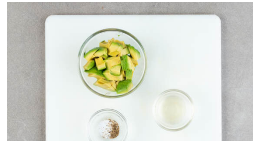
5. Avocados vorbereiten

Sobald die Karotten leicht gebräunt sind, die Kichererbsen für weitere ca. 10Min. auf dem Blech mitgaren.