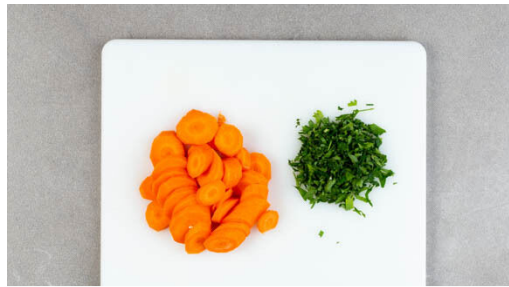
1. Karotten vorbereiten

Energie 457kcal, Fett 30.5g, Kohlenhydrate 29.4g, Eiweiß 14.0g