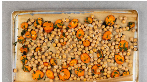
4. Kichererbsen rösten

Inzwischen die Kichererbsen in ein Sieb abgießen, mit kaltem Wasser abspülen und abtropfen lassen. Den Knoblauch schälen, grob würfeln und mit den Kichererbsen vermengen.