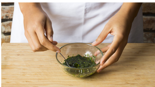
4. Sauce mischen

Währenddessen die Kirschtomaten halbieren. Die Basilikumblätter abzupfen und fein schneiden. Die Petersilie samt Stängeln fein hacken. Die Schalotte und den Knoblauch schälen und fein würfeln. Die Limettenschale abreiben und die Limette halbieren, eine Hälfte auspressen, die andere Hälfte in Spalten schneiden.