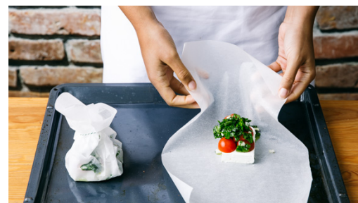
5. Päckchen füllen

Die Kräuter mit den Schalotten , dem Knoblauch , 1-2TL Limettenschale und 2EL Olivenöl verrühren und die Sauce nach Geschmack mit dem Limettensaft , Salz, Pfeffer und 1 Prise Zucker würzen.