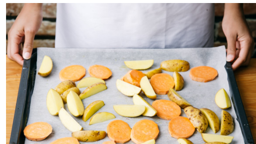
2. Kartoffeln backen

Den Backofen auf 200°C (180°C Umluft) vorheizen. Die Kartoffeln samt Schale in Spalten schneiden. Die Süßkartoffeln schälen und in ca. 0,5cm dünne Scheiben schneiden.