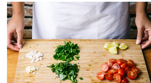
3. Sauce vorbereiten

Die Kartoffeln und die Süßkartoffeln auf einem mit Backpapier ausgelegten Backblech mit 2EL Olivenöl, ½TL Salz und 1 kräftigen Prise Pfeffer vermengen, gleichmäßig verteilen und 30-35Min. im Ofen backen. Ggf. ein zweites Blech verwenden und die Bleche nach der Hälfte der Zeit tauschen.