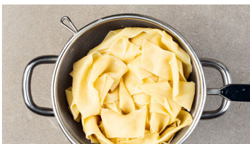
5. Pasta kochen

Den Knoblauch schälen und sehr fein würfeln oder durch eine Knoblauchpresse drücken, zu den Pilzen in die Pfanne geben und ca. 30Sek. anbraten. Die Pilze anschließend aus der Pfanne nehmen und beiseitestellen. Das Hackfleisch in derselben Pfanne mit 1EL Pflanzenöl oder Butter bei mittlerer Hitze 5-6Min. goldbraun braten.