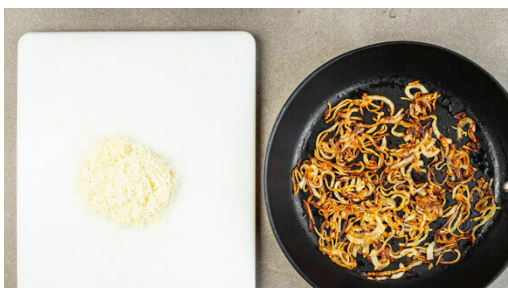
4. Zwiebeln karamellisieren

Die Tomaten grob würfeln und in einem hohen Gefäß mit einem Stabmixer fein pürieren. Das Tomatenpüree mit den Pilzen , dem Brühgewürz und der Sojasauce zum Hackfleisch geben und bei niedriger Hitze ca. 10Min. köcheln lassen. Tipp: Für eine flüssigere Sauce 100-150ml Wasser zugeben und mitköcheln.