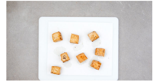
3. Tofu braten

Die Enden der Bohnen abschneiden. Die Paprika vierteln, entkernen und in dünne Streifen schneiden. Die Lauchzwiebel schräg in feine Ringe schneiden, dabei die grünen und weißen Lauchzwiebelringe trennen.