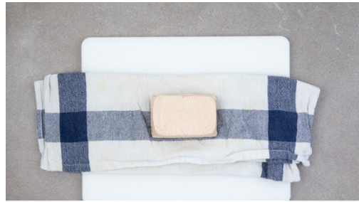
1. Tofu pressen

Allergene Gluten (1), Erdnüsse (5), Sojabohnen (6). Kann Spuren von anderen Allergenen enthalten.