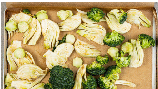
2. Gemüse vorbereiten

Den Reis zu den Zwiebeln in den Topf geben und unter Rühren ca. 1Min. erwärmen. Mit dem Safran samt Einweichwasser und 500ml Wasser ablöschen, dann die Cranberrys und ½TL Salz hinzufügen und aufkochen. Abgedeckt bei niedriger Hitze 12-14Min. köcheln lassen, bis der Reis gar ist. Bis zum Servieren abgedeckt warm halten.