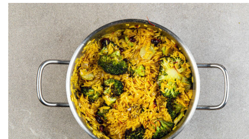
6. Reis verfeinern

Das Gemüse im Ofen ca. 14Min. backen. Die Position der Bleche tauschen, dann den Fenchel und den Brokkoli auf eine Seite des oberen Backblechs schieben und die Kürbiskerne auf der anderen Seite verteilen. Alles zusammen weitere 3-5Min. rösten, bis das Gemüse an den Rändern knusprig wird.