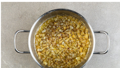
1. Zwiebeln anbraten

Energie 820kcal, Fett 38.8g, Kohlenhydrate 88.0g, Eiweiß 23.1g