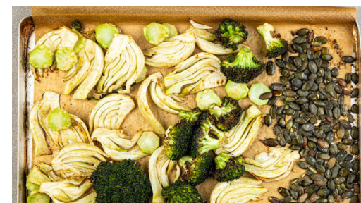
3. Gemüse backen

Den Knoblauch schälen und fein würfeln. Den Koriander samt Stängeln fein schneiden und die Rauchmandeln grob hacken.