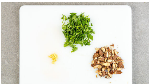
5. Zutaten schneiden

Den Brokkoli in mundgerechte Röschen, den Strunk in dünne Scheiben schneiden. Die Fenchelstängel entfernen, das Fenchelgrün für die Garnitur verwenden. Den Fenchel längs halbieren, in ca. 1cm breite Spalten schneiden und mit dem Brokkoli auf zwei mit Backpapier ausgelegten Backblechen mit je der ½ der Gewürzmischung , 1EL Olivenöl, ½TL Salz und 1 Prise Pfeffer vermengen.