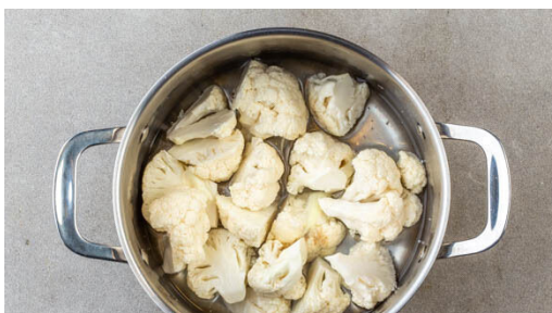
1. Blumenkohl garen

Energie 360kcal, Fett 22.8g, Kohlenhydrate 26.0g, Eiweiß 12.3g