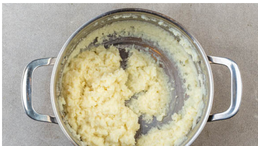
4. Blumenkohl pürieren

In einem großen Topf 600ml leicht gesalzenes Wasser zum Kochen bringen. Den Blumenkohl in kleinere Röschen zerteilen und direkt in den Topf geben. Sobald das Wasser kocht, die Hitze reduzieren und unter gelegentlichem Rühren 10-12Min. köcheln lassen, bis der Blumenkohl sehr weich ist. Vom Herd nehmen und abgedeckt beiseitestellen.