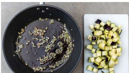
2. Schalotten braten

Den Käse fein reiben. Den Blumenkohl im Topf mit einem Stabmixer fein pürieren. Den Käse und 2EL Butter untermengen und den Blumenkohl bei mittlerer bis niedriger Hitze unter Rühren sanft erwärmen. Dabei ggf. esslöffelweise Wasser zugeben, bis eine cremige, polentaartige Konsistenz entsteht.