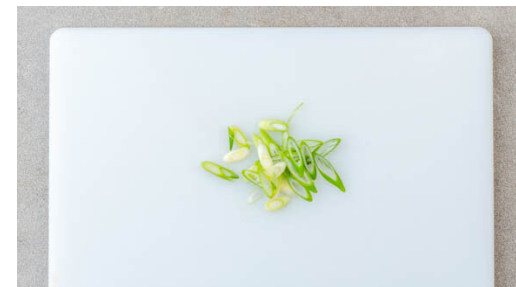
6. Lauchzwiebeln schneiden

Die Auberginenwürfel in die Pfanne geben und bei mittlerer Hitze 5-7Min. braten, bis sie leicht gebräunt sind. Die Tomaten grob würfeln, mit 100ml Wasser in die Pfanne geben und abgedeckt 4-6Min. garen, bis die Auberginen weich sind. Die Auberginenmischung aus der Pfanne nehmen und zu den Schalotten geben. Die Pfanne wird weiterverwendet.