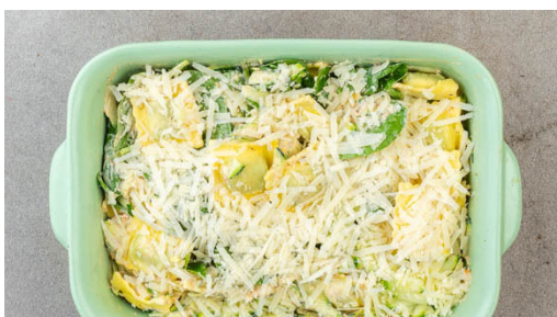
4. Pasta verteilen

In einer großen Auflaufform die Crème fraîche mit der Gewürzmischung , 1TL Salz und ½TL Pfeffer verrühren. Die Pasta in das kochende Wasser geben und ca. 2Min. vorkochen, dann in ein Sieb abgießen und abtropfen lassen.