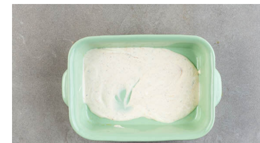
3. Sauce anrühren

Die Tomaten in ca. 0,5cm dünne Scheiben schneiden.