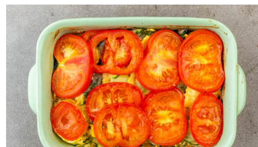
5. Pasta überbacken

Die Zucchini , den Spinat und die Pasta in die Auflaufform geben und vorsichtig vermengen, sodass die Pasta mit dem Gemüse und der Sauce bedeckt ist. Dann die Pasta mit dem Käse bestreuen.