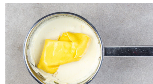
6. Anrichten und servieren

Zwischendurch die Salbeiblätter von den Stängeln zupfen und in einer mittelgroßen Pfanne mit 1-2EL Olivenöl bei mittlerer Hitze knusprig frittieren. Mit einer Gabel herausheben und auf etwas Küchenkrepp abtropfen lassen, dann 2-3EL Butter, 1-2EL Zitronensaft und 1TL Zitronenabrieb in die Pfanne geben, mit dem Öl verrühren und die Zitronenbutter mit 1 Prise Salz würzen.