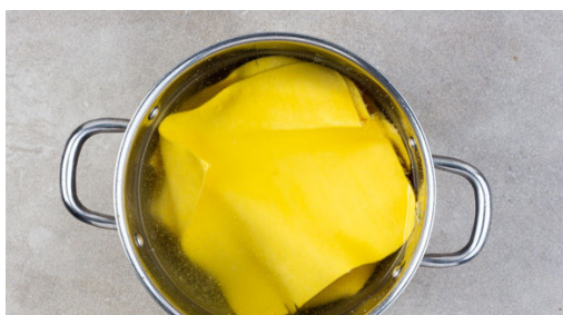
4. Pasta garen

Die Brühe mit 1 Prise Pfeffer würzen, dann 4TL Zitronensaft und 2-3TL Zitronenabrieb unterrühren. Ca. 4/5 des Mascarpone zugeben und die Sauce glatt rühren. Den restlichen Mascarpone für die Garnitur aufbewahren.