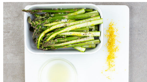
2. Spargel backen

Den Backofen auf 200°C Oberhitze vorheizen. Das Brühgewürz in 600ml warmem Wasser auflösen. In einem kleinen Topf 2EL Mehl mit 2-3EL Olivenöl bei mittlerer Hitze 30Sek. anschwitzen, dann mit der Brühe ablöschen und 10Min. bei niedriger Hitze sanft einköcheln lassen.