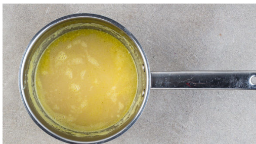
1. Sauce ansetzen

Energie 838kcal, Fett 48.1g, Kohlenhydrate 79.2g, Eiweiß 19.7g