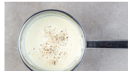
3. Sauce fertigstellen

Die holzigen Enden des Spargels entfernen und die Spargelstangen längs halbieren. Mit 1EL Olivenöl und sowie Salz, Pfeffer und 1 Prise Zucker vermengen und in einer Auflaufform 12-14Min. im Ofen backen. Die Zitronenschale abreiben, dann die Zitronen halbieren und auspressen. In einem großen Topf reichlich Wasser mit etwas Salz für die Lasagneblätter zum Kochen bringen.