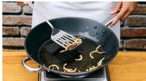
Den Boden einer großen Pfanne mit Pflanzenöl bedecken und auf hoher Stufe erhitzen. Einen Zwiebelstreifen ins Öl geben: Wenn es aufschäumt und Blasen wirft, ist das Öl heiß genug. Die Zwiebeln portionsweise bei starker Hitze ca. 3Min. goldbraun braten, aus der Pfanne nehmen und auf Küchenkrepp abtropfen lassen. Den Schnittlauch in kleine Röllchen schneiden.