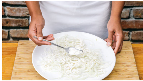
Die Zwiebel schälen, halbieren und in sehr dünne Halbringe schneiden. Die einzelnen Halbringe mit den Fingern auseinanderziehen, dann die Zwiebelstreifen auf einem großen Teller mit 1EL Mehl bestäuben und gut vermengen.

Allergene Gluten (1), Eier (3), Milch (7). Kann Spuren von anderen Allergenen enthalten.