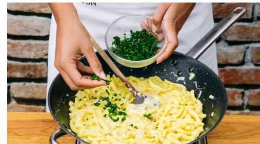
Die Pfanne auswaschen und 350ml Wasser hineingießen. Das Brühgewürz unterrühren und bei starker Hitze auflösen. Die Spätzle , den Hartkäse und den Emmentaler in die Pfanne geben und ca. 5Min. wenden, bis die Flüssigkeit verdampft ist und der Käse Fäden zieht. Mit Salz und Pfeffer würzen, dann die 1/2 des Schnittlauchs unterheben.