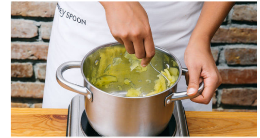
Die Apfelspalten und den Zimt nach Geschmack in den Topf geben und abgedeckt bei mittlerer Hitze ca. 4Min. köcheln lassen, bis die Äpfel weich sind und leicht zerfallen. Die Äpfel mit einer Gabel zu einem Kompott zerdrücken und nach Geschmack mit etwas Zucker verfeinern. Bis zum Servieren beiseitestellen.