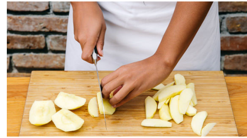
Die Äpfel schälen, vierteln, entkernen und in dünne Spalten schneiden. 200ml Wasser in einem mittelgroßen Topf zum Kochen bringen. Den Hartkäse fein reiben. Den Emmentaler grob hacken.