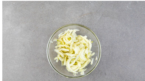
Den Fenchel halbieren, den Strunk entfernen und das Fenchelgrün abzupfen. Den Fenchel in feine Streifen schneiden und mit je 1TL Zucker und Salz kräftig mit den Händen verkneten.

Wer keine Grillpfanne hat, kann auch eine normale Pfanne verwenden.