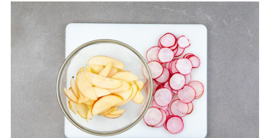
Den Apfel vierteln, entkernen und in dünne Scheiben schneiden. Die Apfelscheiben mit dem Limettensaft vermengen. Die Radieschen in dünne Scheibchen schneiden.