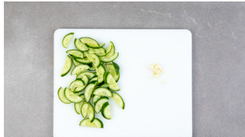
Die Gurke der Länge nach halbieren und schräg in dünne Scheiben schneiden. Den Knoblauch schälen und in feine Würfel schneiden.