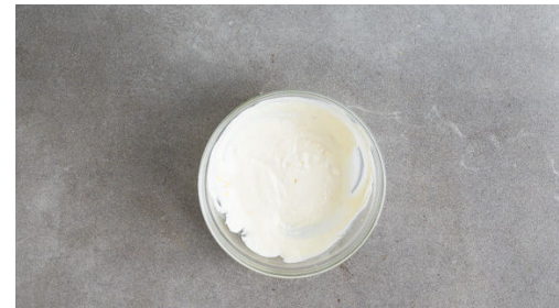
5. Creme zubereiten

Den Brokkoli in 2-3cm große Röschen schneiden, den Strunk ggf. schälen und in dünne Scheiben schneiden. Den Knoblauch schälen und fein würfeln. Die Zitronenschale abreiben und die Zitrone halbieren, eine Hälfte in ca. 0,5cm breite Scheiben, die andere Hälfte in Spalten schneiden.