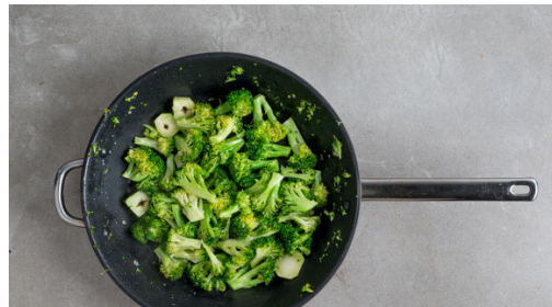
4. Brokkoli garen

Die Kartoffeln schälen und in ca. 3cm große Stücke schneiden. In einem mittelgroßen Topf mit gesalzenem Wasser bedecken und zum Kochen bringen, dann in 15-20Min. gar kochen. Mit einer Tasse etwas Kochwasser abschöpfen, die Kartoffeln in ein Sieb abgießen, zurück in den Topf geben und warm halten.