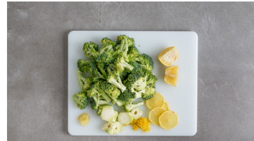
2. Brokkoli schneiden

Den Brokkoli in einer großen Pfanne mit 1EL Olivenöl bei mittlerer Hitze ca. 1Min. anbraten. Etwas Wasser in die Pfanne geben und den Brokkoli 2-3Min. abgedeckt garen. Den Deckel entfernen und den Knoblauch sowie Salz und Pfeffer unterrühren und den Brokkoli nach Geschmack noch 1Min. oder etwas länger braten.