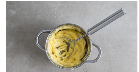
6. Kartoffeln stampfen

Den Lachs mit kaltem Wasser abspülen und evtl. vorhandene Gräten mit einer Pinzette entfernen. Von beiden Seiten mit insgesamt 1EL Olivenöl sowie Salz und Pfeffer einreiben. In eine bei mittlerer Hitze erwärmte Grillpfanne oder normale Pfanne geben, mit den Zitronenscheiben belegen und 3-4Min. anbraten. Mit den Zitronenscheiben wenden und weitere 3-4Min. braten.