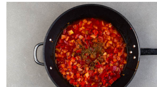
3. Sauce köcheln

Den Schnittlauch und die Petersilie samt Stängeln fein schneiden und die \frac{1}{2} der Kräuter in die Sauce rühren. Mit Salz und Pfeffer abschmecken.