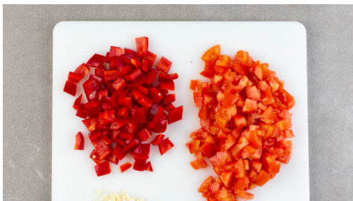
2. Gemüse schneiden

Inzwischen den Bulgur in den Topf mit dem kochenden Wasser rühren und abgedeckt bei niedriger Hitze 5-7Min. sanft köcheln lassen, bis das Wasser aufgesaugt und der Bulgur gar ist. Noch ca. 5Min. ohne Hitzezufuhr ziehen lassen.