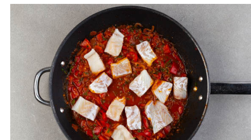
6. Fisch garen

Die Paprika , die Tomaten , die Gewürzmischung , 1TL Zucker, 1 kräftige Prise Salz und das aufgekochte Wasser in die Pfanne geben und zum Kochen bringen, dann bei mittlerer Hitze ca. 12Min. köcheln lassen, bis die Sauce die gewünschte Konsistenz hat.