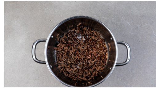
Das Hackfleisch in einem mittelgroßen Topf mit 3-4EL Olivenöl bei starker Hitze 3-4Min. anbraten. Mit Salz und Pfeffer würzen.