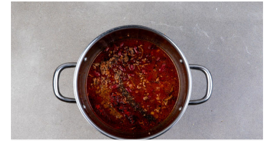
Ca. 2/3 der Zwiebeln und die 1/2 des Knoblauchs dazugeben und 1-2Min. mitbraten. Mit der 1/2 des Paprikapulvers und der 1/2 des Kreuzkümmels würzen, dann das Tomatenmark , die Bohnen samt Flüssigkeit , 400ml Wasser und das Brühgewürz unterrühren. 5-10Min. sanft köcheln lassen, dann das Chili mit den restlichen Gewürzen sowie Salz und Pfeffer abschmecken.