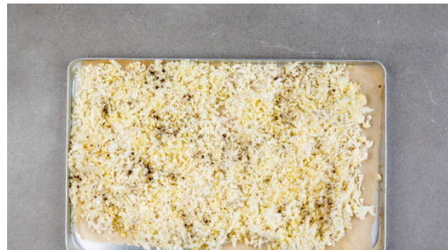
Den Blumenkohl halbieren oder ggf. vierteln, den Strunk entfernen und den Kohl mit einer Küchenreibe grob raspeln. Den Blumenkohl auf einem mit Backpapier ausgelegten Backblech verteilen, mit 2-3EL Olivenöl beträufeln und mit Salz und Pfeffer würzen. Anschließend 10Min. im Ofen rösten, bis der Blumenkohlreis an den Rändern leicht bräunt, aber noch bissfest ist.