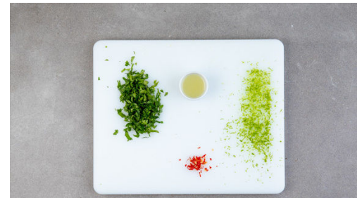
Die Limettenschale abreiben, dann die Limetten halbieren und auspressen. Die Chilischote längs halbieren, für weniger Schärfe entkernen und in möglichst feine Streifen schneiden. Den Koriander samt Stängeln fein schneiden.